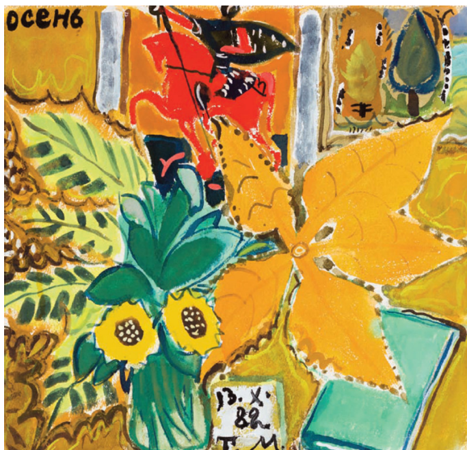
Татьяна Маврина, «Осень»